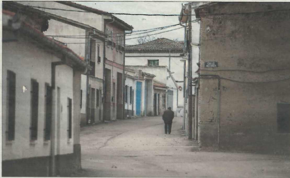
Un vecino del municipio de Alaraz (Salamanca) pasea por el pueblo.